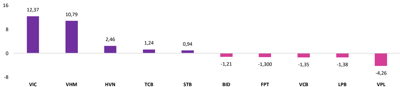
Nguồn: EVS & Fiinpro